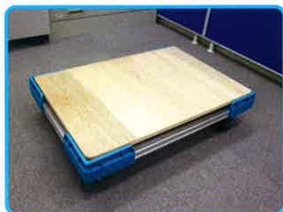
オプション① 床面合板

アルミ製の異なる長さのバー(角パイプ)を差替えるだけで、サイズフリーの台車を実現！日常の様々なシーンにおいて活躍する、耐摩耗性に優れた軽くて静かな走行性能のキャスターです。