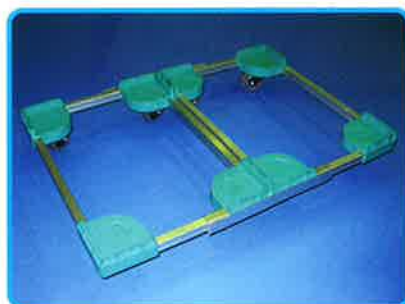
アタッチメント金具で連結自由自在