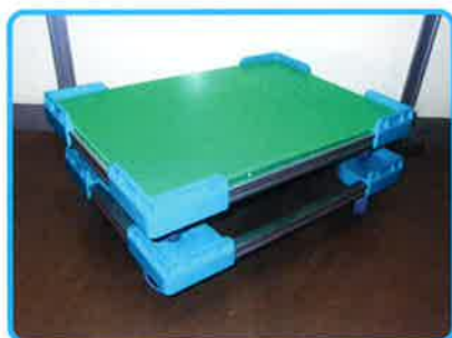
オプション② 床面ダンブラ